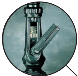
Incluida puerta de registro